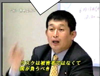
リスクは被害者ではなくて国が負うべき