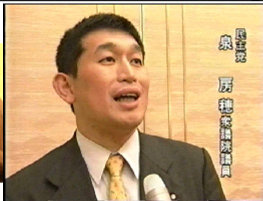
民主党 泉 房穂 衆議院議員

講演後、テレビの取材を受け、NHKやサンテレビのニュースで、講演の様子やインタビューが放送されました